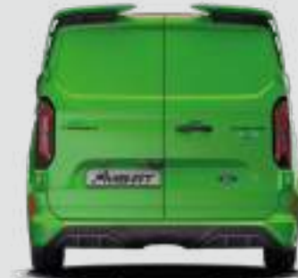
2275 mm (Z LUSTERKAMI)