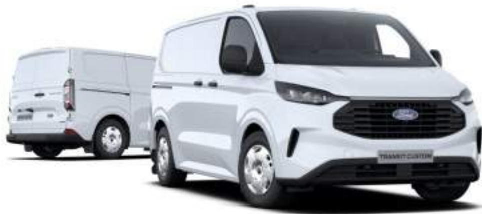
Nowy Ford Transit Custom VAN L1 w wersji Trend z lakierem zwykłym Frozen White (bez dopłaty)