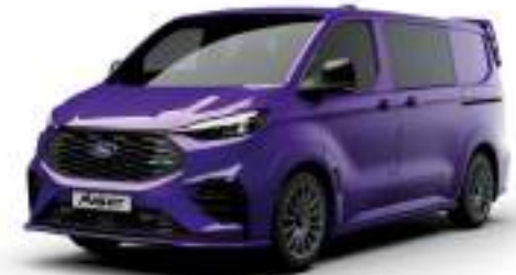
ENW PURPLE - LAKIER SVO

2 500 zł | lakier dostępny tylko dla wersji TREND i MS-RT