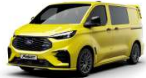
CADMIUM YELLOW - LAKIER SVO

2 500 zł | lakier dostępny tylko dla wersji TREND i MS-RT