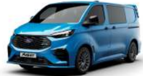
MS-RT BLUE - LAKIER SVO

2 500 zł | lakier dostępny tylko dla wersji TREND i MS-RT