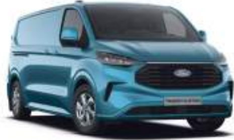
DIGITAL AQUA BLUE - LAKIER ZWYKŁY

2 750 zł | lakier niedostępny dla wersji TRAIL. Dla wersji TREND dostępny tylko z napędem elektrycznym